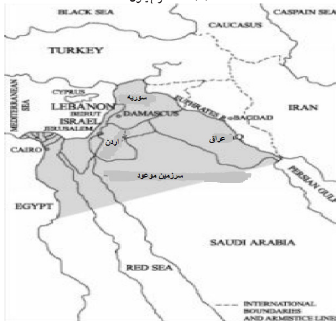
نقشه (۱) نقشه طرح بنون

قدرت جهانی». به عبارت دیگر، هدف شارون و نتانیاهو این است که بعد از فریب دادن همه جهانیان، آمریکایی‌ها را فریب دهد. همچنین جنگ انرژی بخش مهم راهبرد آمریکا، اسرائیل، عربستان و ترکیه علیه دولت اسد است (Blog, ۲۰۱۶, ۲۰۵).