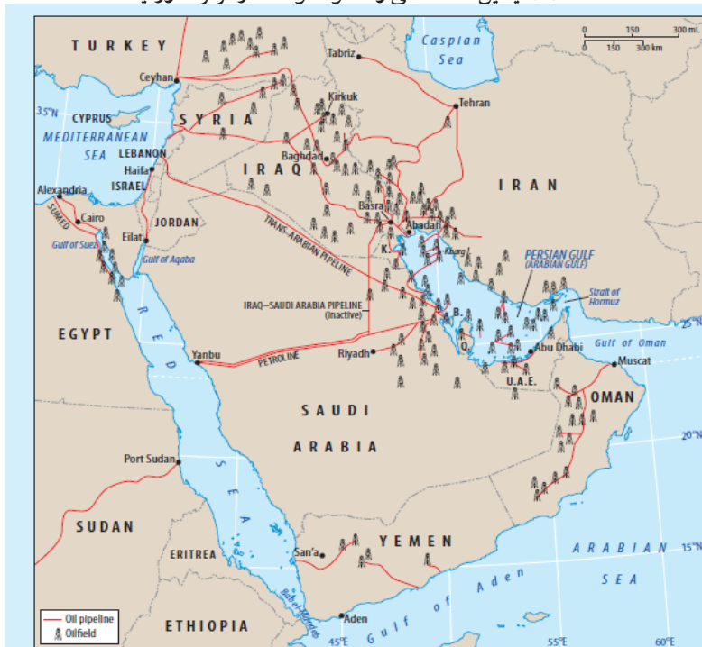
نقشه (۲) میادین عمده نفتی و خطوط لوله‌ها در مرکز خاورمیانه