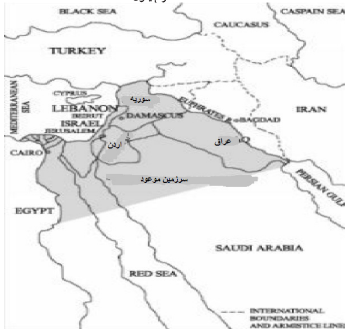
نقشه (۱) نقشه طرح بنون

قدرت جهانی). به عبارت دیگر، هدف شارون و نتانیاهو این است که بعد از فریب دادن همه جهانیان، آمریکایی‌ها را فریب دهد. همچنین جنگ انرژی بخش مهم راهبرد آمریکا، اسرائیل، عربستان و ترکیه علیه دولت اسد است (Blog, 2016, 205).